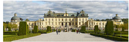
Palaciu de Drottningholm